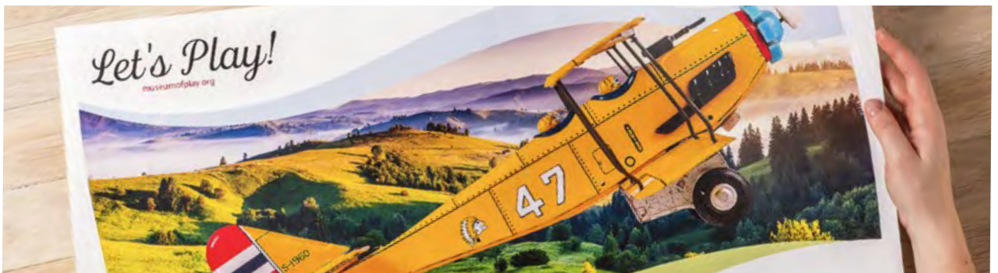
Impression sur feuille extra longue - dimensions de papier maximales 330,2 x 660 mm