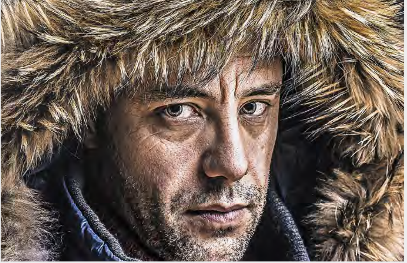
Résolution ultra-haute définition