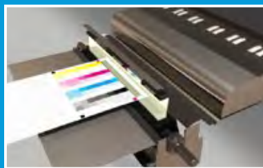
Système Full Width Array (FWA)

Le module image sur support automatisé assure un alignement de l'image parfait et un enregistrement de la première à la dernière page quel que soit le format de la feuille ou le type de support. Cela permet de gagner du temps et d'éliminer le gaspillage coûteux dû aux erreurs d'enregistrement ou au mauvais positionnement des images.